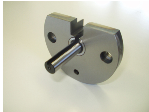
上) 軸装着後ボディー